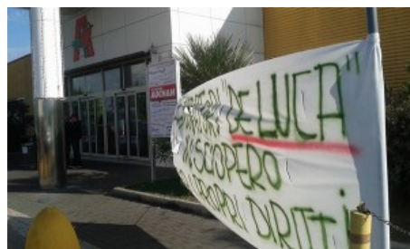
Lavoratrici pulizie presso Auchan Giugliano (Na)