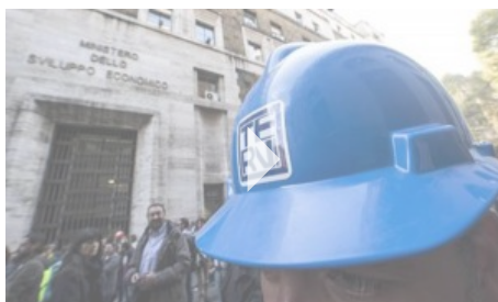
[Bruxelles] Intervista lavoratori AST (Terni)