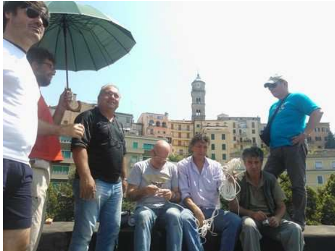
Frosinone. Gli operai sul tetto del comune in piazza VI Dicembre

La Digos cerca invano il dialogo. Gli operai: "se salite ci buttiamo nel vuoto"